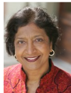
NAVI PILLAY, Haut Commissaire aux droits de l'homme de l'ONU

Dans la vidéo, la Haut Commissaire parle des récentes attaques violentes contre les gens LGBT aux États-Unis, Brésil, Honduras et en Afrique du Sud, soulignant que de tels incidents, loin d'être isolés, font partie d'un problème global. « Ultimement, l'homophobie et la transphobie ne diffèrent pas du sexisme, de la misogynie, du racisme ou de la xénophobie », note-t-elle, « mais ces dernières formes de préjugés sont condamnées par les États alors que l'homophobie et la transphobie sont trop souvent écartées. » Le site web du BHCDH offre le scénario complet de la vidéo en fichier Word (français, anglais, espagnol et arabe).